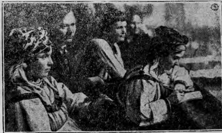
НА СНИМКЕ: Слушают прения по докладу тов. Молотова. На переднем плане—делегатки—колхозницы Мордовской обл.

колхоза. Здесь беднота пела кулацким подголоском, заявляя: „не хотим, чтобы из колхоза были в правлении, они (т. е. колхозники) не наши и для нас работать не будут“.