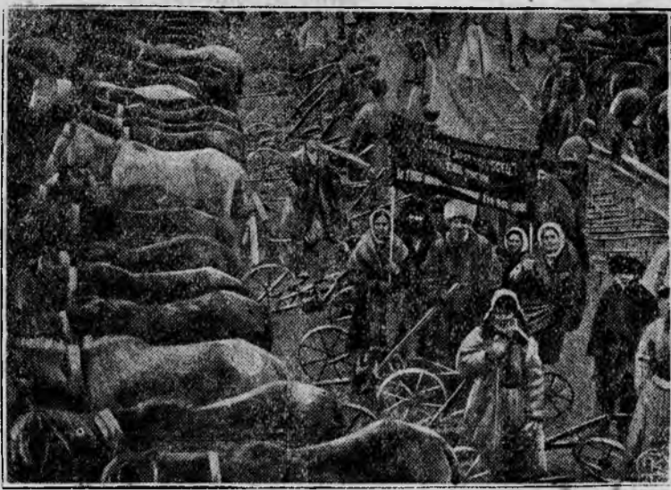
Станица Тифлисская (Ираптонинский район Сев. Кавказ) сплошной коллективизации, закончив подготовку к севу, проводит сейчас смотр подготовленности к севу. НА СНИМКЕ: Пробный выезд колхозников в поле.